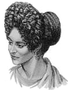
Frau mit Palla und Tunika Frauenfrisur (1. Jh. n. Chr.) Kunstvolle Frisur, ca. 100 n. Chr.