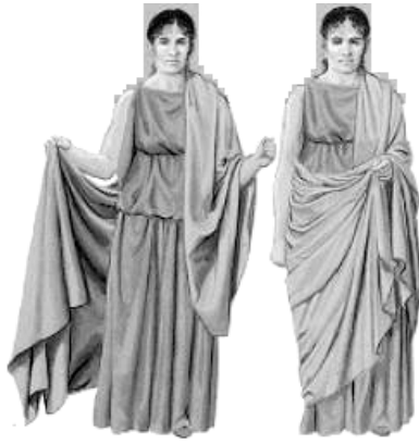
Die Palla , ein Frauenmantel