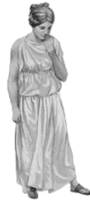
Eine Frau in einer langen Tunika