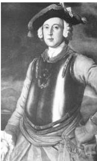
Karl Friedrich Hieronymus Freiherr von Münchhausen (geb. am 11. Mai 1720 in Bodenwerder; gest. am 22. Februar 1797)

war ein deutscher Adliger aus dem Kurfürstentum Braunschweig-Lüneburg. Ihm werden weit über hundert Lügengeschichten zugeschrieben.