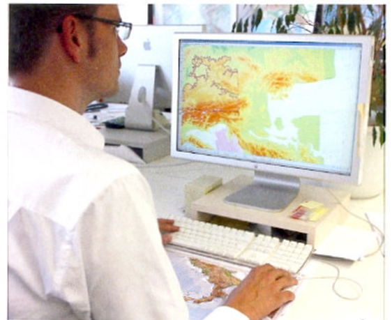
Ein Kartograf bei der Arbeit

Einfach gezeichnete Symbole zeigen übersichtlich, wo zum Beispiel ein Haus steht, eine Straße verläuft oder ein Waldgebiet ist. In einer Legende wird die Bedeutung der verschiedenen Kartenzeichen erklärt. Die Zeichen sind nicht auf jeder Karte gleich. Sie sind aber meist so gezeichnet, dass man leicht verstehen kann, was sie bedeuten.