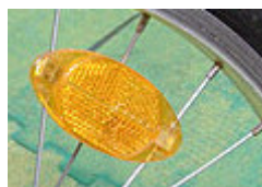
gelbe Seitenrückstrahler an Vorder- u. Hinterrad