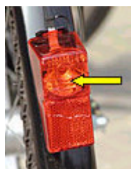
rotes Rücklicht mit rotem Rückstrahler