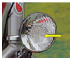
Frontrückstrahler mit Scheinwerfer