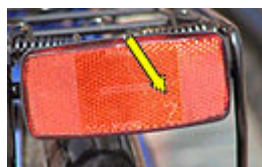
zusätzlicher großer roter Rückstrahler (Z-Rückstrahler)