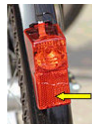
roter Rückstrahler unterhalb vom Rücklicht