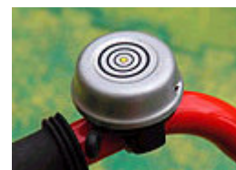
hell tönende Glocke