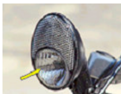
Scheinwerfer mit Frontrückstrahler