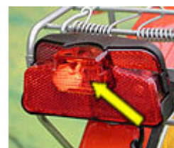
rotes Rücklicht im zusätzlichen Rückstrahler