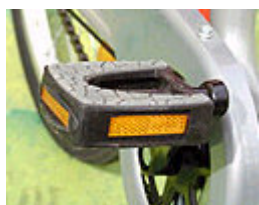
gelbe Tretrückstrahler an den Pedalen