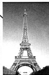
Eiffelturm in Paris