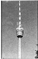
Fernsehturm in Stuttgart