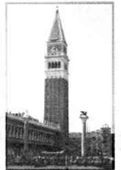
Campanile in Venedig