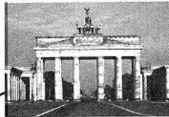
Brandenburger Tor in Berlin