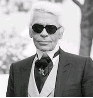
Modeschöpfer Karl Lagerfeld