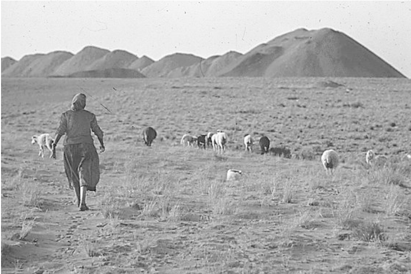
Schafhirtin der Dine im Navajo-Nation-Reservat

Die Navajo-Nation (auch englisch Navajo Indian Reservation, navajo-sprachl. Dinétah) ist mit 67.339 km 2 das größte Indianerreservat in den USA . Sie wurde den Diné -Indianern im Jahr 1868 durch General William T. Sherman vertraglich zugesichert. Die Hauptstadt ist Window Rock, Arizona .